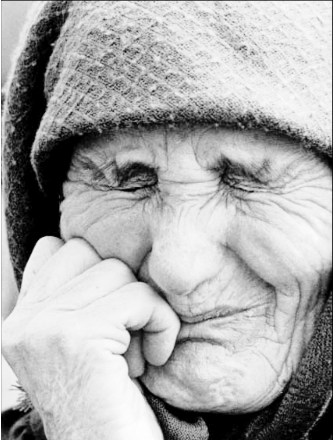
Mujer albano-kosovar en el campo de refugiados de Stenkovec de Macedonia. Alrededor de 850.000 albano-kosovares, en su mayoría mujeres y niños, huyeron o fueron expulsados de Kosovo entre marzo y junio de 1999. Todos ellos huían de violaciones graves de derechos humanos como detenciones arbitrarias, «desapariciones», torturas (incluida la violación) y homicidios.