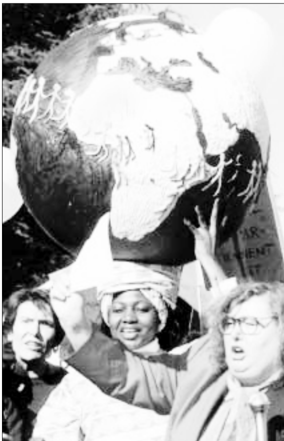
Suiza, octubre del 2000. Manifestación por los derechos de la mujer, dentro del marco de la Marcha Mundial de la Mujer.

En Italia, en febrero de 1999, el Tribunal Supremo (Tribunal de Casación) anuló la sentencia dictada por un tribunal de apelación en la que se declaraba a un profesor de autoescuela culpable de violar a una alumna de 18 años. El Tribunal Supremo, señalando que la víctima vestía unos pantalones vaqueros cuando se cometió el delito, observó: «Es de todos conocido [...] que los pantalones vaqueros no se pueden quitar ni siquiera parcialmente sin la cooperación activa de quien los lleva [...] y ello resulta imposible si la víctima lucha con todas sus fuerzas». El tribunal resolvió que esto indicaba que la víctima había consentido en mantener la relación sexual, concluyó que no se había demostrado la existencia de una violación y remitió el sumario a otro tribunal de apelación para que se celebrara un nuevo juicio.