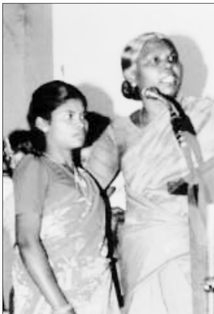
Mujeres dalit en una audiencia pública sobre la violencia contra miembros de la comunidad dalit celebrada en Chennai (India) en 1998. ( Dalit significa literalmente «personas rotas» y se aplica a los miembros de las castas clasificadas, antes conocidos como «intocables».) Los dalit son un grupo social desfavorecido y las mujeres dalit son habitualmente víctimas de la violencia.