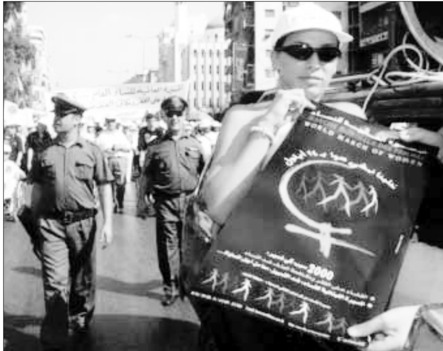
Beirut (Líbano), septiembre del 2000. Miles de mujeres participan en una marcha por los derechos de la mujer y contra la discriminación sexual y la violencia, dentro del marco de la Marcha Mundial de la Mujer.