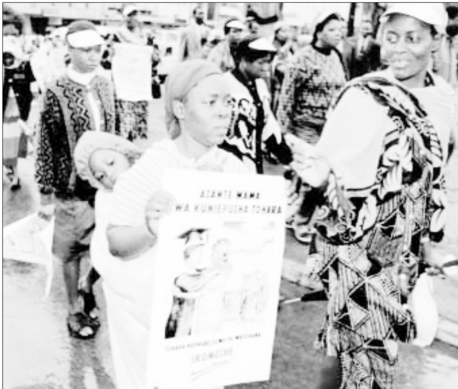
Cientos de mujeres se manifiestan en Nairobi (Kenia) en protesta por la violencia contra la mujer. Esta manifestante lleva un cartel que dice: «Gracias, mamá, por no circuncidarme».