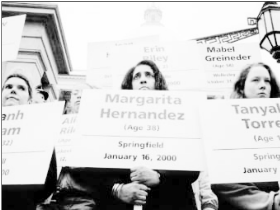
Manifestantes contra la violencia doméstica frente a la sede de la legislatura estatal, Boston (EE.UU.), octubre del 2000. En los carteles figuran los nombres de mujeres que, según los manifestantes, murieron el año anterior a causa de la violencia doméstica.

internacionales y de las resoluciones de los tribunales nacionales, perfeccionan y concretan la interpretación de los actos que constituyen tortura. 6 Gracias en gran medida a los esfuerzos del movimiento mundial de mujeres, está cada vez más extendida la idea de que la tortura incluye, en determinadas circunstancias, los actos de violencia que cometen ciudadanos particulares.