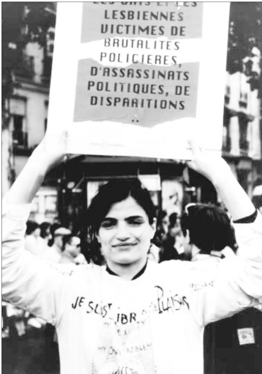
Activista de AI en la celebración del Día del Orgullo Gay en París (Francia), con un cartel que llama la atención sobre los abusos contra los derechos humanos de gays y lesbianas. La regulación por el Estado y la comunidad de la sexualidad de la mujer suele hacerla vulnerable a la violencia y a los tratos degradantes.