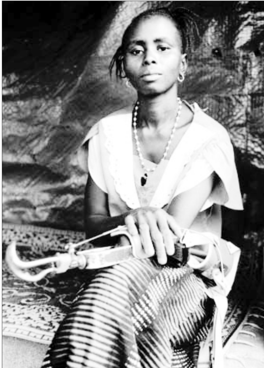
Sierra Leona. Las fuerzas rebeldes que atacaron en 1997 la granja de esta mujer de 38 años le amputaron un brazo. Ahora vive en el campo para amputados de Murray Town, en Freetown, donde le han dado un brazo artificial y está aprendiendo de nuevo a realizar tareas como sembrar.