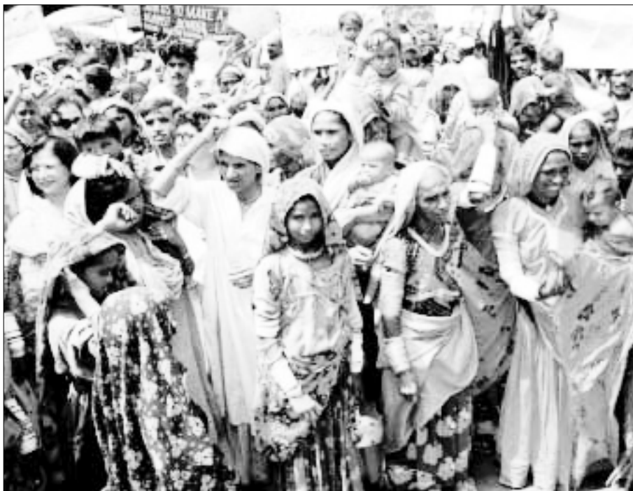
Trabajadoras sometidas a servidumbre por deudas.