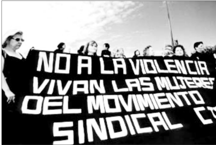
Costa Rica. Mujeres vestidas de negro piden el fin de la violencia contra la mujer frente a la Corte Suprema, noviembre de 1999.

sar dolor concebidos por los torturadores: palizas, descargas eléctricas, simulacros de ejecución y amenazas de muerte, privación de sueño y sensorial. Las han suspendido en el aire, golpeado en las plantas de los pies, asfixiado, sumergido en agua.