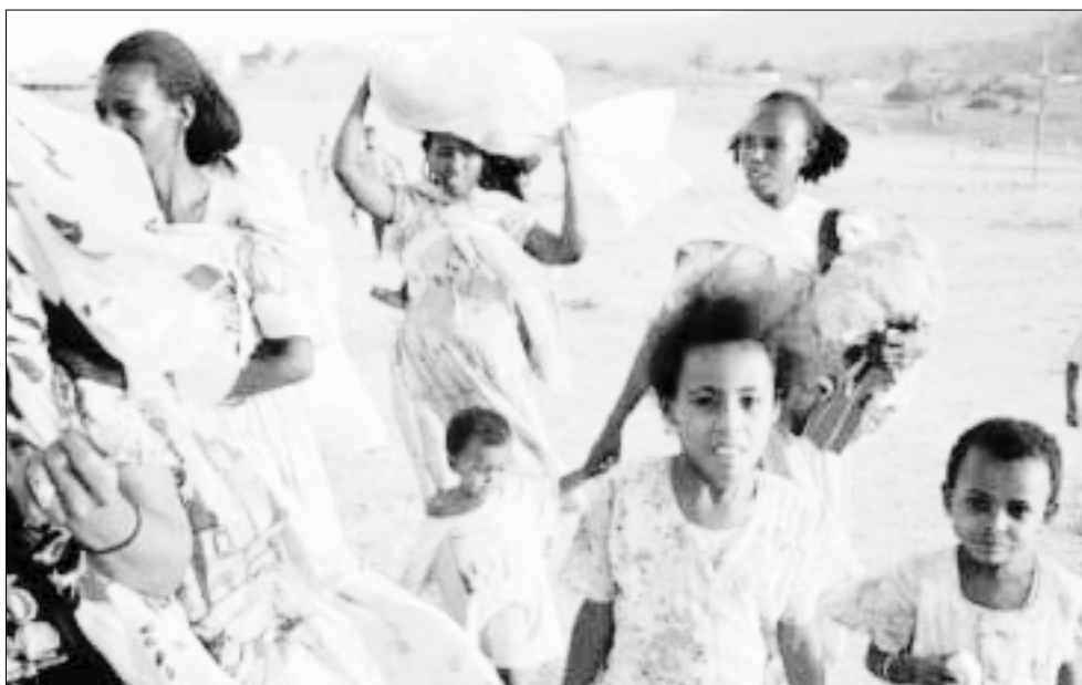
Mujeres y niños en un centro de recepción de Eritrea para desplazados internos que huyen del recrudecimiento de los combates en mayo del 2000 en la frontera entre Etiopía y Eritrea. La mayoría de los refugiados y desplazados internos del mundo son mujeres y niños.

Las desplazadas internas y las refugiadas que viven en campos pueden ser víctimas de abusos sexuales y malos tratos físicos. A veces los guardias de los campos y los refugiados varones consideran a las mujeres y niñas no acompañadas una propiedad sexual común, o que las mujeres que ya han sido violadas han perdido su virtud y que, por tanto, se puede abusar de ellas. Estas mujeres han de soportar el dolor físico y psicológico del