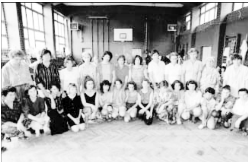
Mujeres bosnias musulmanas en el campo de refugiados de Tuzla (noreste de Bosnia). Estas mujeres fueron violadas sistemáticamente por milicianos serbios durante la guerra que asoló la ex Yugoslavia entre 1991 y 1995. Accedieron a ser fotografiadas para que «el mundo sepa la verdad» sobre la guerra de Bosnia.

Casi todas las víctimas de violación en Sierra Leona han requerido tratamiento médico por las lesiones físicas sufridas. Una mujer de 29 años que huyó de la ciudad de Make-ni, en la Provincia del Norte, en mayo del 2000, declaró a los representantes de Amnistía Internacional un mes después: «Aunque aún estoy amamantando a mi bebé, me violaron cinco rebeldes del Frente Revolucionario Unido. Todavía sangro.» La mayoría de las mujeres violadas han contraído enfermedades de transmisión sexual, y se cree que muchas tienen el VIH/SIDA. Nadie sabe cuántos embarazos y nacimientos ha habido como consecuencia de las violaciones. 56