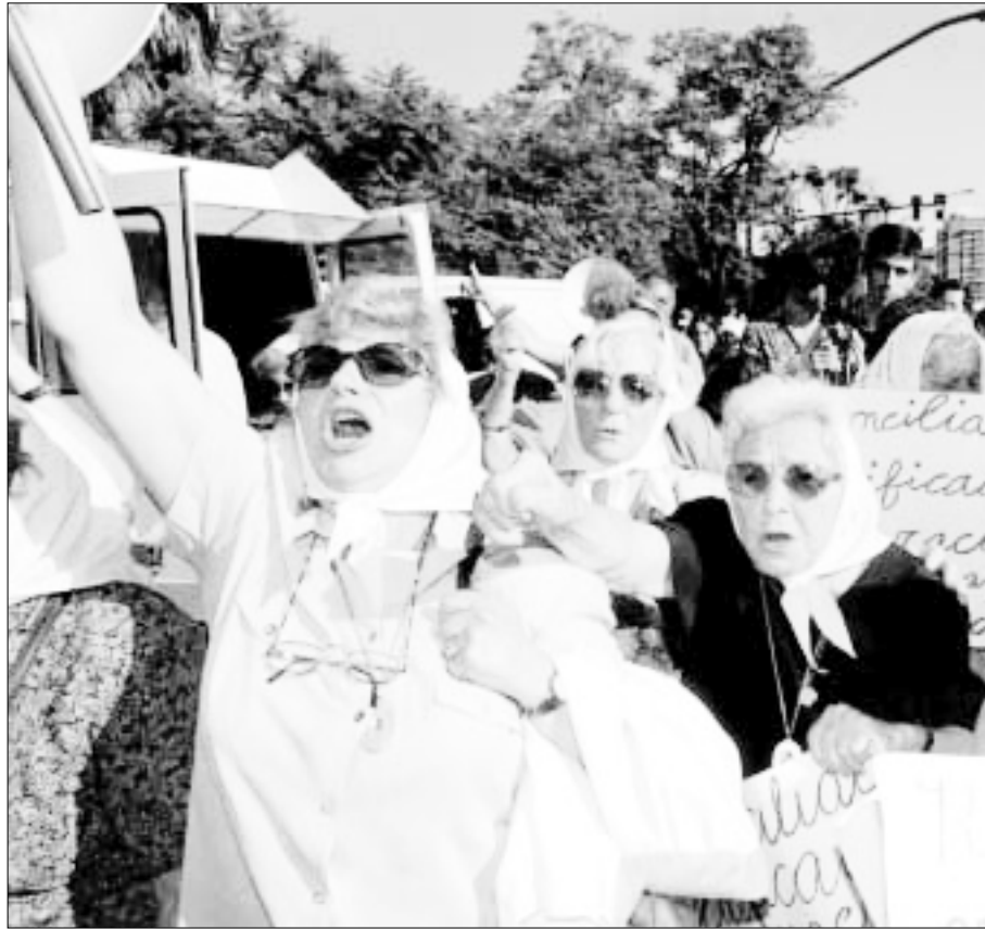
Mujeres argentinas en representación de las Madres de Plaza de Mayo se manifiestan frente a la Escuela de Mecánica de la Armada (ESMA) de Buenos Aires, tristemente famosa por haber sido empleada como centro de torturas en Argentina en los años setenta y principios de los ochenta. Las mujeres protestan contra el plan de destruir el edificio y sustituirlo por un monumento a la unidad nacional.

Los actos de tortura que se cometen en un conflicto armado se producen en un contexto caracterizado por la quiebra del sistema policial o judicial en el que, por tanto, han desaparecido las restricciones que pesan habitualmente sobre los actos de violencia contra la mujer. Además, las penalidades y privaciones obligan a muchas mujeres a «someterse» y mantener relaciones sexuales no deseadas. Los conflictos armados, y los desplazamientos que éstos provocan, propician el aumento de todas las formas de violencia, incluida la violencia doméstica contra la mujer. 57